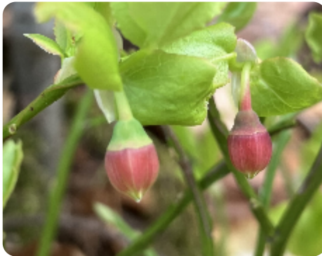
Floraison d'Altitude › Floraison et fructification › Avant floraison

Pour ne pas confondre la myrtille avec les autres