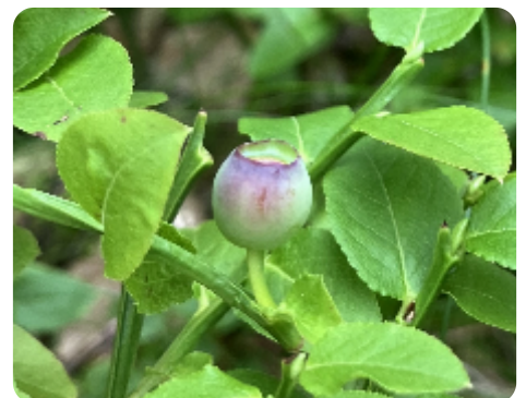
Floraison d'Altitude › Floraison et fructification › Après floraison