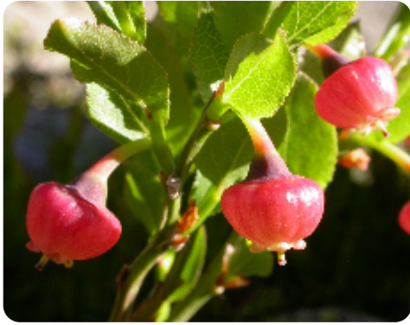
Floraison d'Altitude › Floraison et fructification › Fleurs épanouies