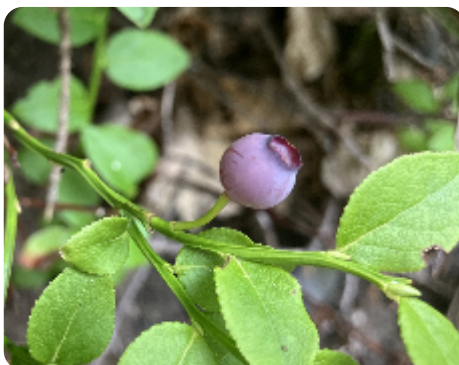
Floraison d'Altitude › Floraison et fructification › Fruits mûrs