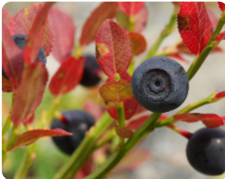
Floraison d'Altitude › Floraison et fructification › Fruits mûrs