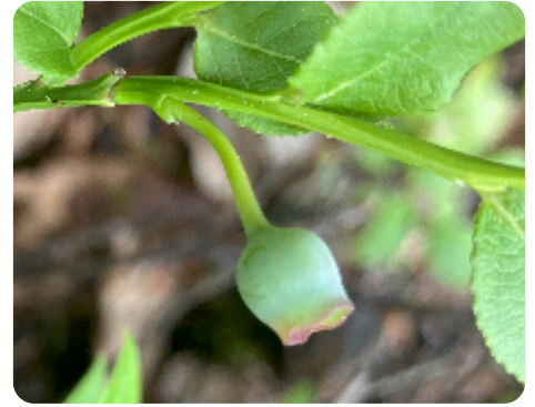
Floraison d'Altitude › Floraison et fructification › Après floraison