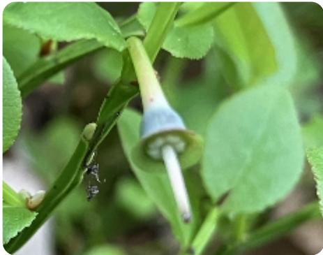
Floraison d'Altitude › Floraison et fructification › Après floraison